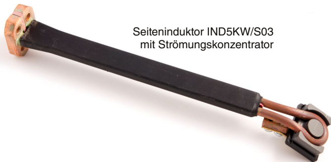
Seiteninduktor IND5KW/S03 mit Strömungskonzentrator