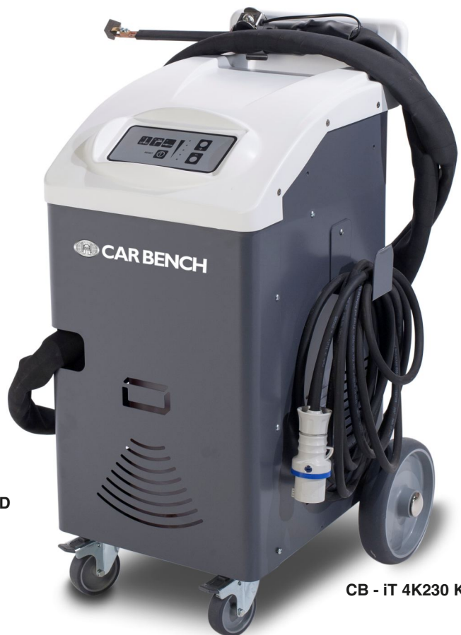
CB - iT 4K230 KB