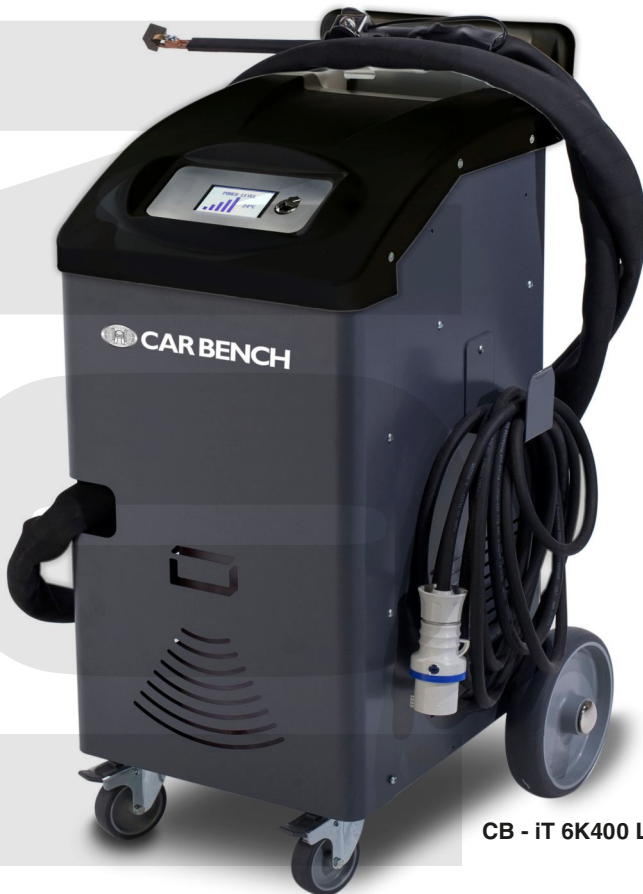
CB - iT 6K400 LCD