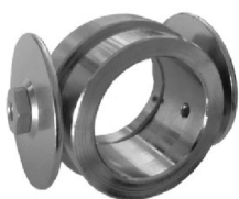
Kompasswagen für CP 40